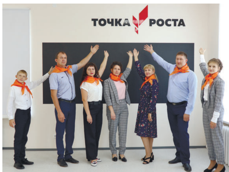
Открытие «Точки роста» в Знаменской школе