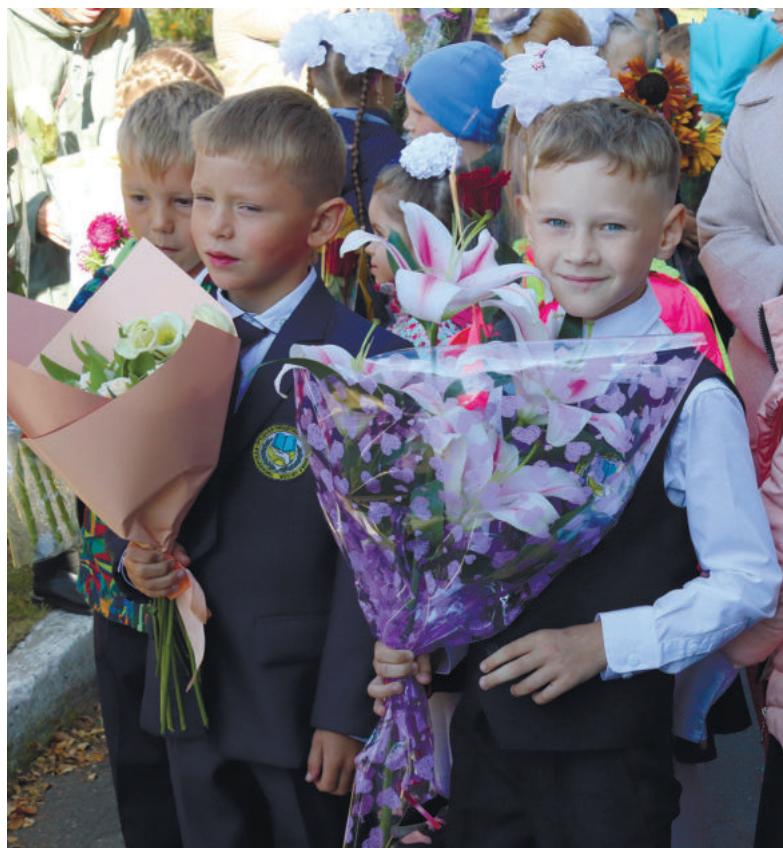
Первое сентября в Пионерской школе

В Пионерской школе для малышей состоялась торжественная линейка в школьном дворе. Нынче в это учреждение поступили 77 первоклассников, всего