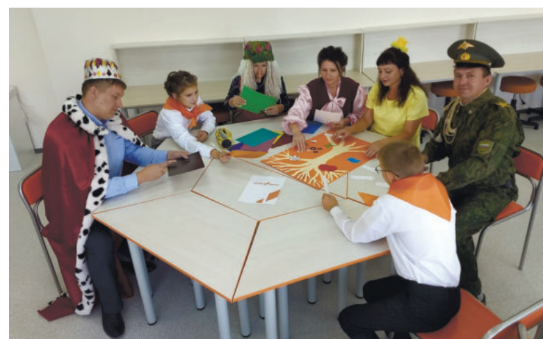
Первое занятие в Знаменском центре образования