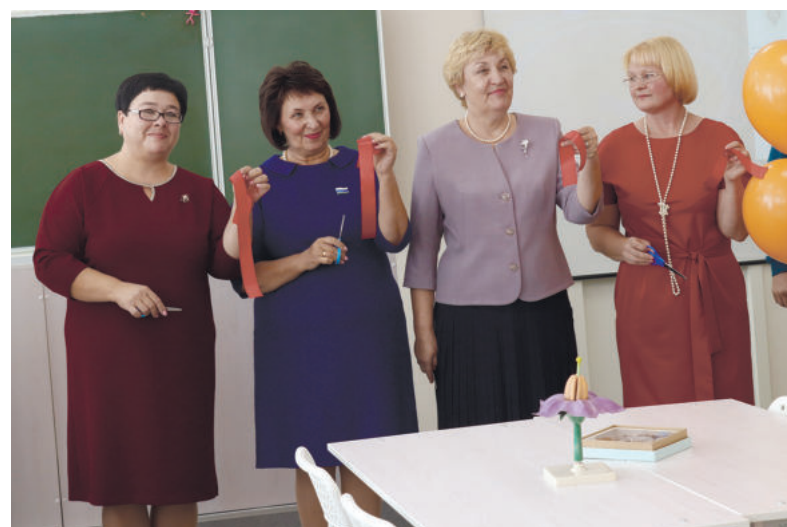
Открытие «Точки роста» в Дубской школе

Ксения Мальгина