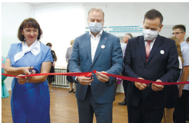
Открытие центра «Точка роста» в Речкаловской школе

же в школе обучаются 612 человек в 27 классах.